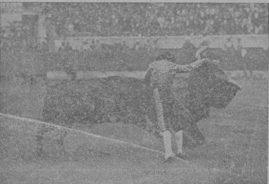
Chicuelo, veroniquando al primer toro de la tarde.