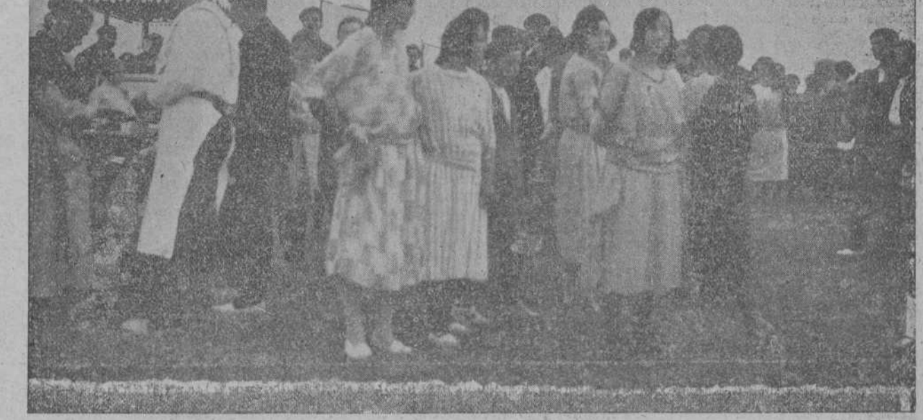
LAS ROMERIAS EN LA PROVINCIA.—Un detalle de la animada romería celebrada en Hinojedo con motivo de la festividad de San Carmen.

La fama de Pedro Campón se extiende ya por toda España y traspasarán las fronteras cuando se conozcan los doce transcendentes puntos—Wilson ideó dos más, que no es.