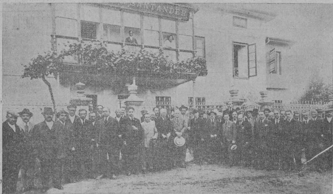
SARÓN.—Grupo de asistentes a la inauguración de la Sucursal del Banco de Santander, en Sarón, efectuada el pasado domingo.

Chicago está a la cabeza con tres muertos y veinte heridos; San Luis está en segundo lugar, con unos sesenta heridos; la mayor parte niños.