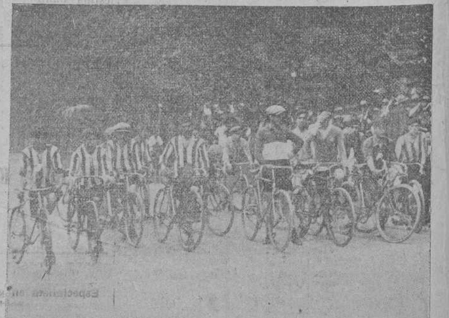
DE LA CARRERA CICLISTA DEL DOMINGO.—Los corredores alineados en la meta, momentos antes de la salida.