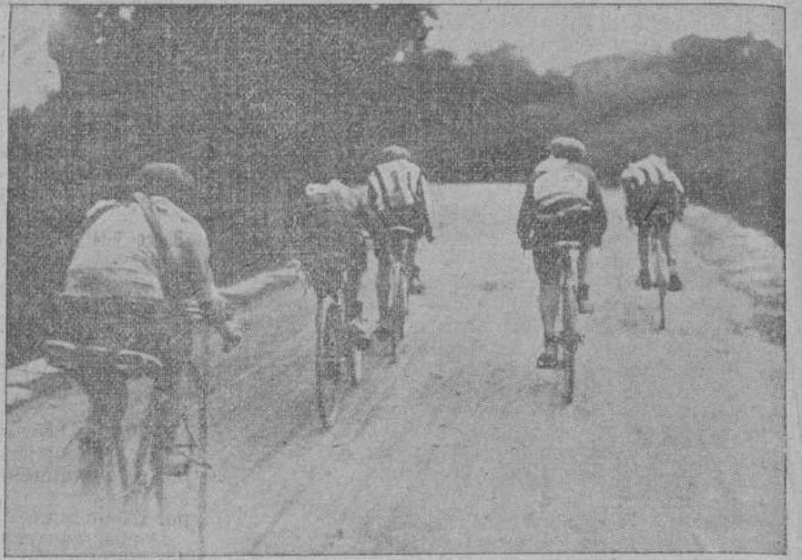
DE LA CARRERA CICLISTA DEL DOMINGO.—El pelotón de cabeza suena la pendiente de Pedroa, camino de Torrelavega.

El Guarnizo va progresando, acoplado su gente, dando vida a un conjunto que se presenta excelentemente para futuras luchas.