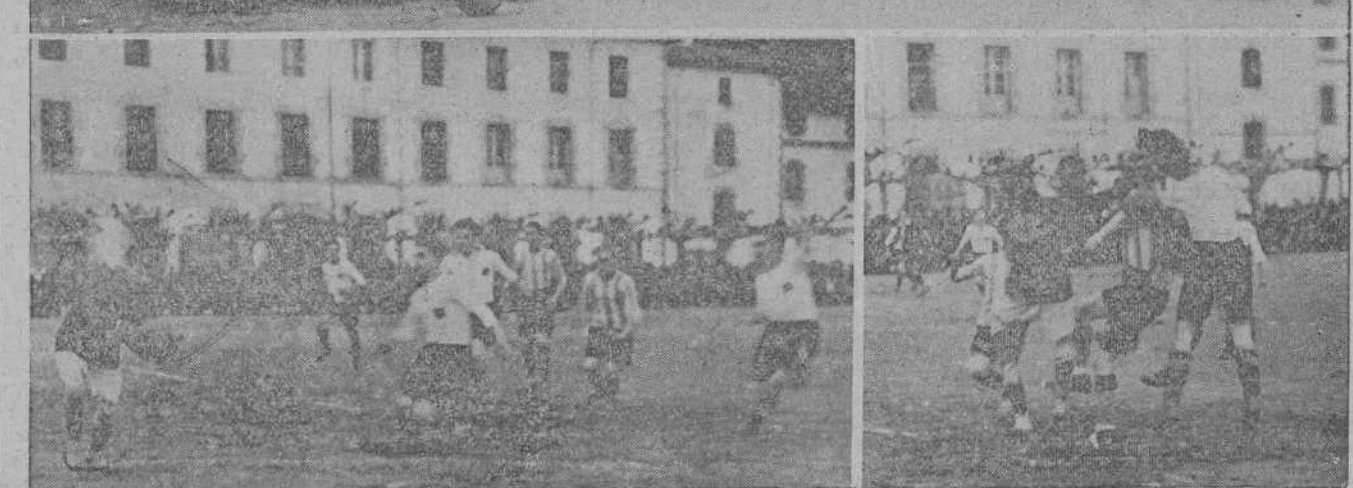
SANTONA.—Los equipos Unión Santofoesa y New Racing Club, que jugaron el domingo un partido eliminatorio de campeonato.—Dos jugadas del encuentro.

decir, que en calidad de juego están a la misma altura. Su medio centro, pasados los primeros momentos de juego indeciso, llevó la línea delantera con acierto, haciéndose notar su mejor intuición que la del resto de sus compañeros.