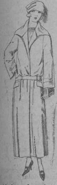
Abrigos de gabardina inglesa, impermeabilizada, en negro, azul y color. De ptas. 70 a 165.