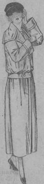
Guardapolvos de dril crudo, gris, etc. De ptas. 25 a 42.