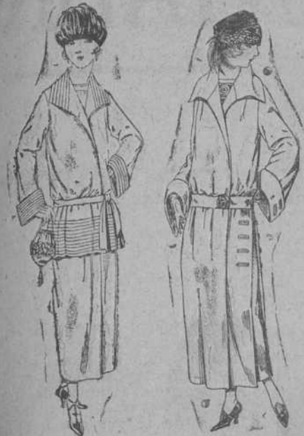
Trajes sastrer, de sarga inglesa, cheviot, etc., adorno pliegues, chaqueta forrada de seda, en negro, azul y color. De ptas. 130 a 165.

SUCURSALES: Madrid, Barcelona, Alicante, Almería, Bilbao, Cádiz, Cartagena, Gijón, Granada, Málaga, Palma de Mallorca, Santander, Sevilla, Valencia, Valladolid, Zaragoza.