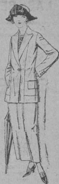
Trajes sastrer, de sarga inglesa, satén, estambre, etc., adornos pespunte seda, chaqueta forrada de seda en marino, negro y colores moda. De ptas. 115 a 157.