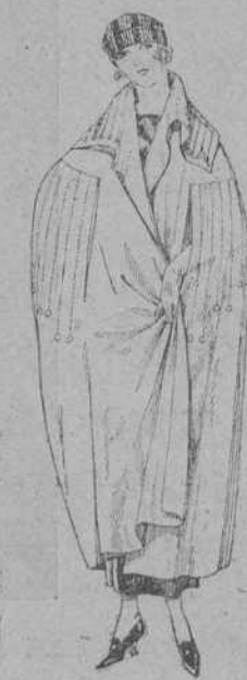
Capas de gabardina, paneta, etc., de diferentes colores. De ptas. 85 a 125.

Peletería, Camisería, Géneros de punto, Corbatería, Guantería, Sombrerería, Zapatería, Paraguas, Bastones y Artículos de viaje.