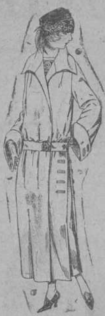
Abrigo de gamuza, gabardina, etc., en negro, azul y color. De ptas. 70 a 100.