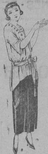
Paletots de punto de seda, adornos bordados. De ptas. 47 a 122.