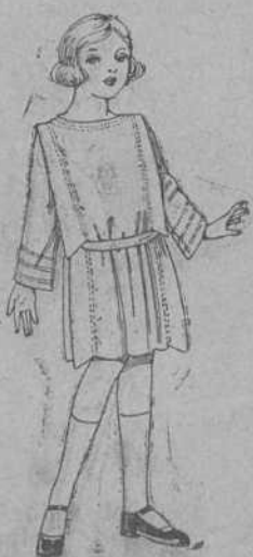
Vestidos de sarga inglesa, popeline, etc., en azul y color, adornos pespunte seda para niñas de 4 a 9 años. De ptas. 35 a 42.