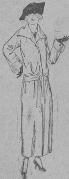
Guardapolvos de dril, satén, etc., colores moda. De ptas. 29 a 50.