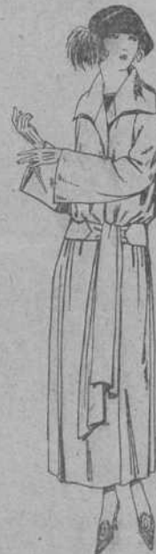
Abrigos de cheviot, gabardinas, ratina, etc., en negro, azul y color. De ptas. 50 a 75.