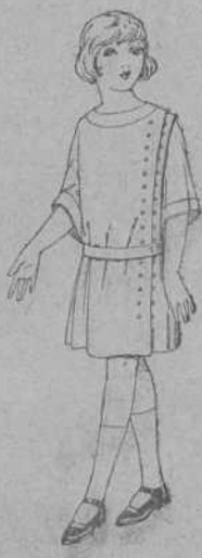
Vestidos de crepé de lana, estambre, etc., en azul y color, para niñas de 4 a 9 años. De ptas. 30 a 40.