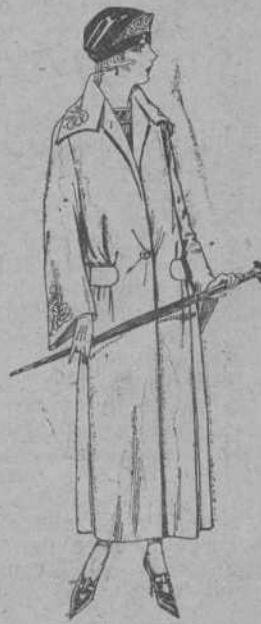
Abrigos de gamuza, ratina, etc., en negro, azul y color, adornos bordados. De ptas. 85 a 110.