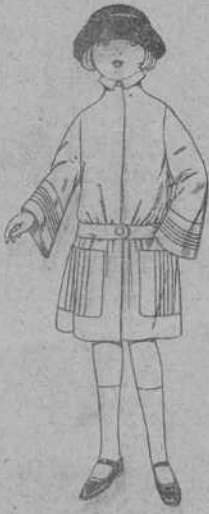
Abrigos de gamuza, cheviot, etc., en azul y color, para niñas de 4 a 9 años. De ptas. 33 a 40.