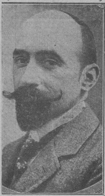
El insigne escritor don Jacinto Benavente, a quien se le ha concedido el premio Nobel de Literatura del año 1922.