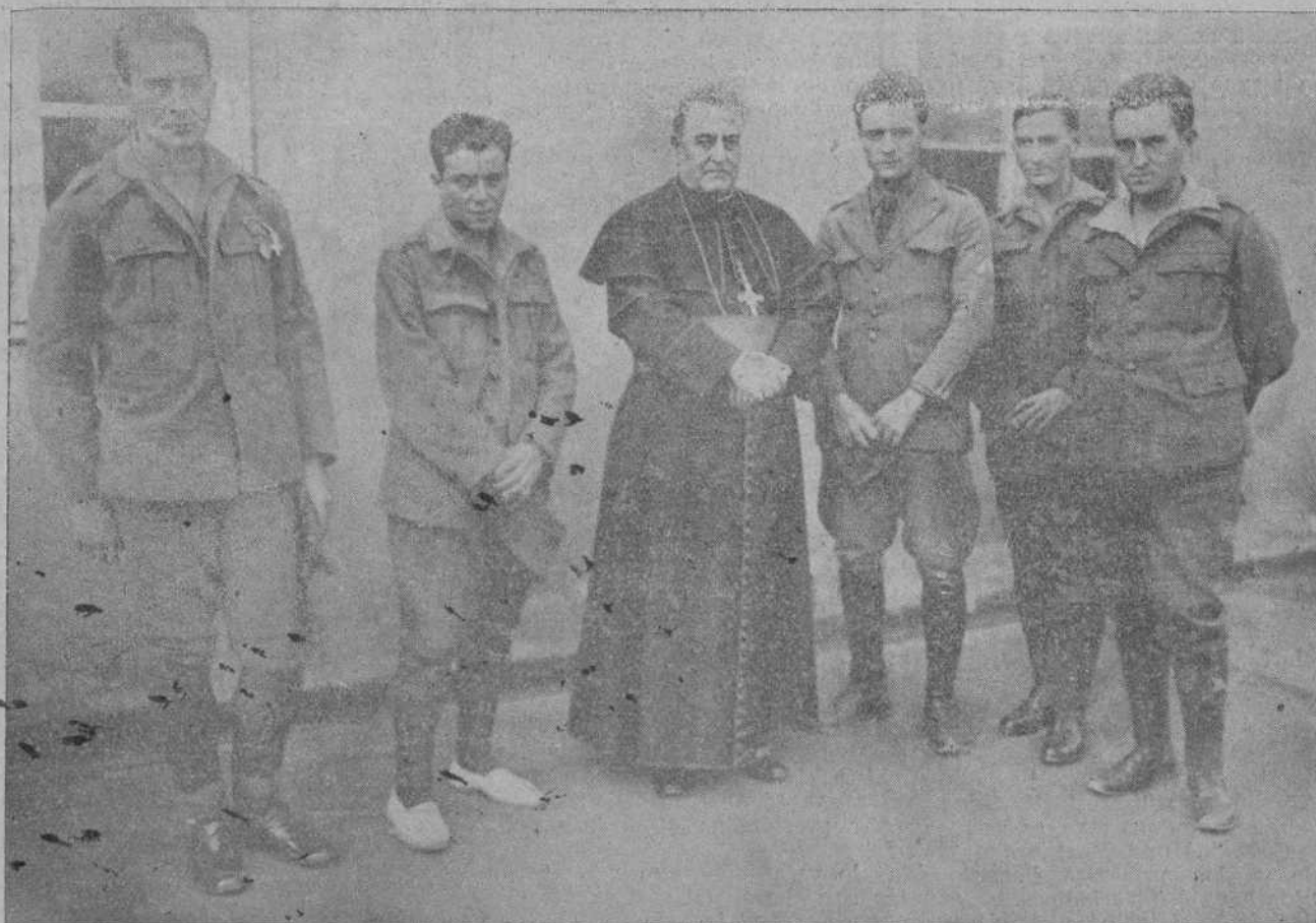
EL OBISPO DE SANTANDER RODEADO DE LA COMISION DE LEGIONARIOS MONTANESES QUE AYER LE VISITÓ.

En vista de que transmitir y recibir noticias del grave pleito militar resulta inútil, rogamos a nuestro corresponsal que atienda otros extraños de la información del día y gracias a esta renuncia conseguimos el acto liberal de Zaragoza, en el que los señores concentrados en este sitio al Poder, para hacer, claro está, la felicidad del país, y otras noticias que en sus correspondientes secciones publicamos. De manera es que, para enjuiciar con acierto, es conveniente esperar. Pero pensando en que las señas no son las más favorables para que ese optimismo especial de que el jefe del Gobierno alardea.