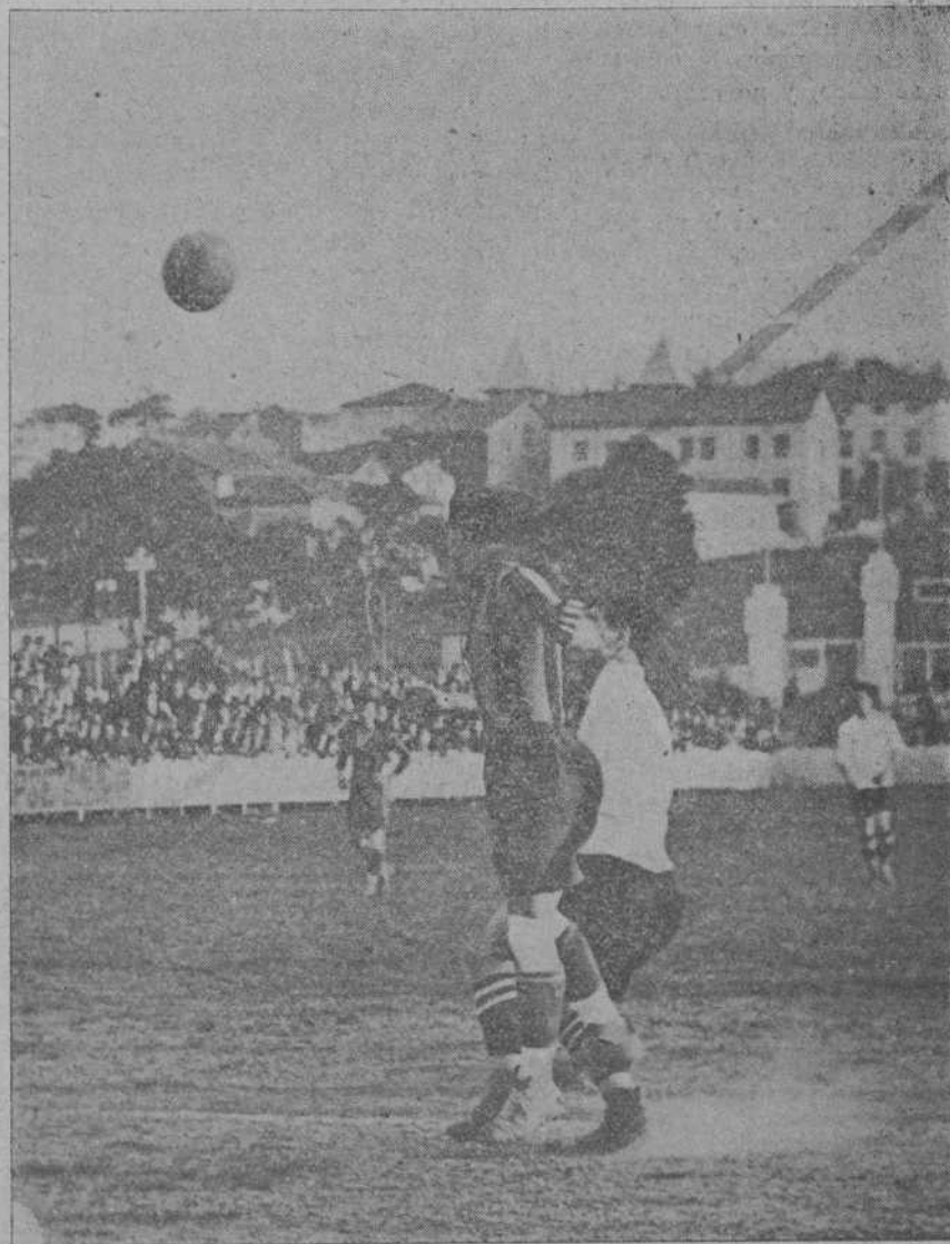
DEL PARTIDO BARACALDO RACING.—Un defensa bilbaíno cortando un bonito avance de Oscar.

Toda la correspondencia política y literaria dirigirla a nombre del Sr. Director de este periódico.