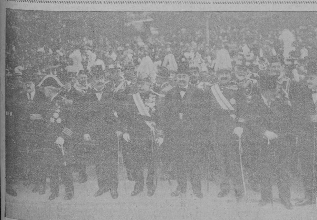
MADRID.—AUTORIDADES CIVILES Y MILITARES QUE PRESIDIERON LA MISA EN SUFRAGIO DE LAS VICTIMAS DEL DOS DE MAYO.

Rogamos a cuantos tengan que dirigirse a nosotros que mencionen el apartado de Correos de EL PUEBLO CANTABRO núm. 13.