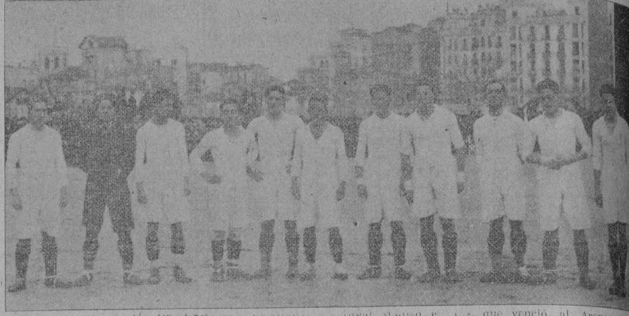
DEL CAMPEONATO DE ESPAÑA.—El equipo del Real Madrid F. C., que venció al Arenas de Guecho, quedando campeón de las regiones Centro y Norte.

ROMA.—Se ha dicho que Caruso había dejado a sus herederos cincuenta a sesenta millones de dólares. Un ex empresario de Caruso ha manifestado acerca de esto lo siguiente: «Creo que Caruso ha ganado una suma que se acerca a esa cantidad. En su testamento, que yo mismo he depositado en Deutsche Bank, de Berlín, hacía mención de una fortuna de unos siete millones de liras. Esto ocurría en 1913, y los que conocen los inmuebles que dejó Caruso y lo que ha ganado desde 1914 hasta 1920, calculan que a su interés averdendería esa fortuna a treinta millones de liras, cantidad suficiente para asegurar la vida de sus herederos.