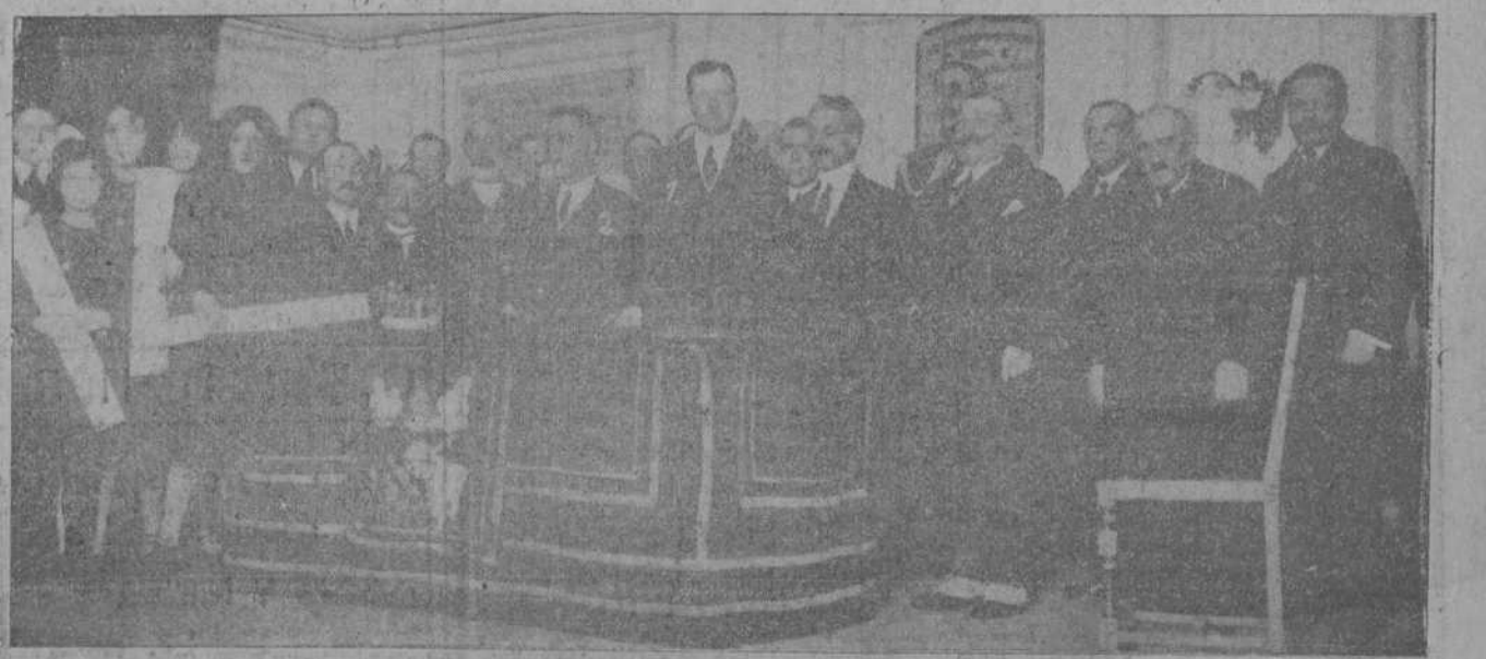
MADRID.—Reparto de premios por el infante don Fernando (I) y al señor Silió, en el Fomento de las Artes.

UN CRIMEN SOCIAL. BARCELONA, 21.—Cuando salían del trabajo los obreros de un taller de la calle de San Pedro, fueron agredidos a tiros por cuatro desconocidos. A consecuencia del atentado dos trabajadores resultaron heridos de gravedad. Los agresores se dieron a la fuga, sin que pudieran ser detenidos. DICE EL GOBERNADOR. El señor Martínez Anido conversó hoy con los periodistas, hablando del restablecimiento de las garantías y de los detenidos gubernativos. Dijo que el restablecimiento de las garantías era un punto esencial para la vida del actual Gobierno, y que así lo había podido comprobar durante su último viaje a Madrid, y que él no había juzgado oportuno oponerse por no crear un conflicto, pero que se consideraba al margen de sus consecuencias. Añadió que una vez restablecidas las garantías serán libertados los presos gubernativos; pero que antes debía que cambiar impresiones y recibir instrucciones del Gobierno. Terminó diciendo que él espera que la libertad de los detenidos no servirá para perturbar el orden público, pero que si así sucediera no le quedará más remedio que encarcelarlos de nuevo.