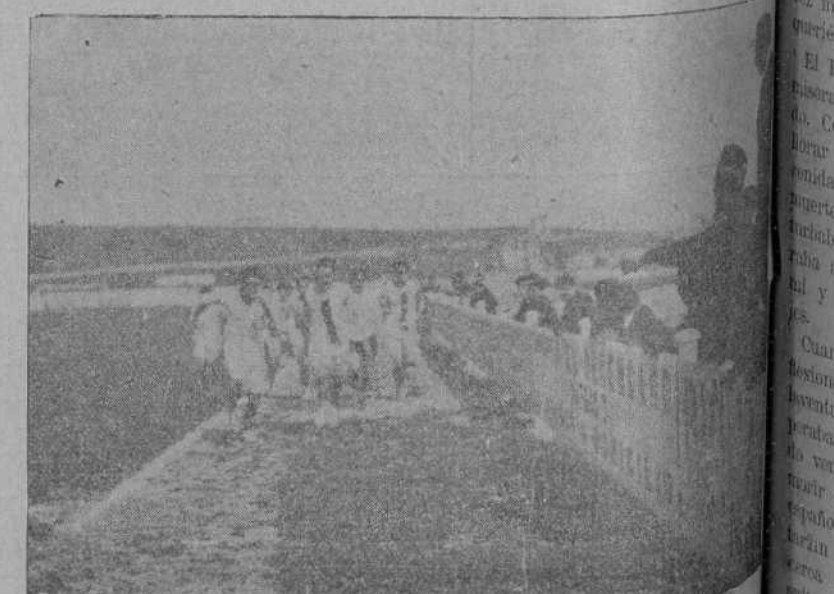
DEL «CROSS» DEL DOMINGO.—Momento de salir los competidores.