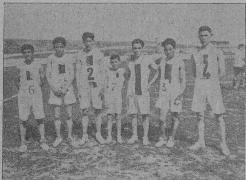
DEL «CROSS» DEL DOMINGO.—El equipo de la Unión Montañesa, que ganó la copa del presidente de la Federación.

DEL «CROSS» DEL DOMINGO.—Momento de salir los competidores.