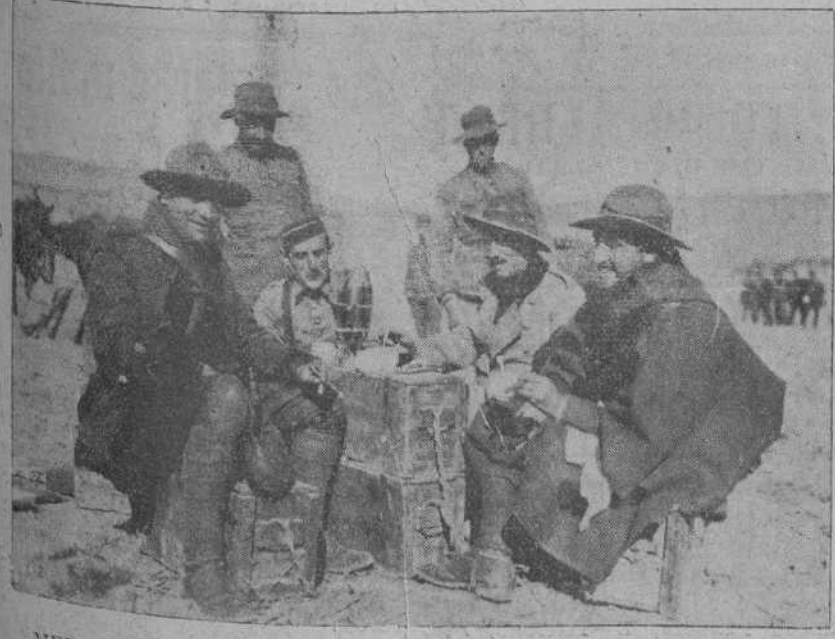
MELILLA.—La «republica» de los oficiales de ametralladoras del batallón de Valencia en el campamento.

El cadáver del tercer aviador será conducido mañana a la estación del Norte, con objeto de trasladarlo a Inglaterra, donde será inhumado en el panteón de familia.