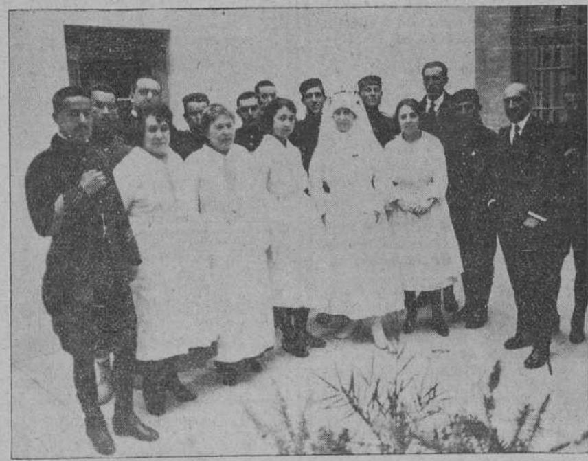
MALAGA.—Señoras de la Cruz Roja que se distinguen por su comportamiento en el cuidado de los soldados montañeses enfermos o heridos.

Inspirarán sus reses. Y una vez admitidas por el tribunal juzgador competente se abonarán los gastos todos de ida al Concurso.