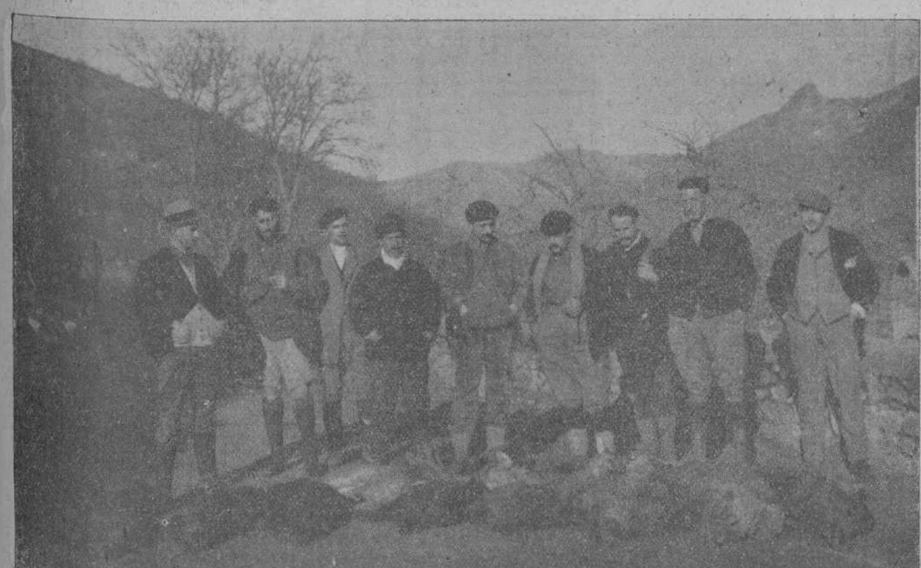
INTERESANTE FOTOGRAFIA DE LAS PIEZAS COBRADAS EN UNA RECIENTE CACERIA CELEBRADA EN LOS MONTES DE SAJA. EN LA QUE TOMARON PARTE DISTINGUIDOS CAZADORES MONTAÑESES Y BILBAINOS.