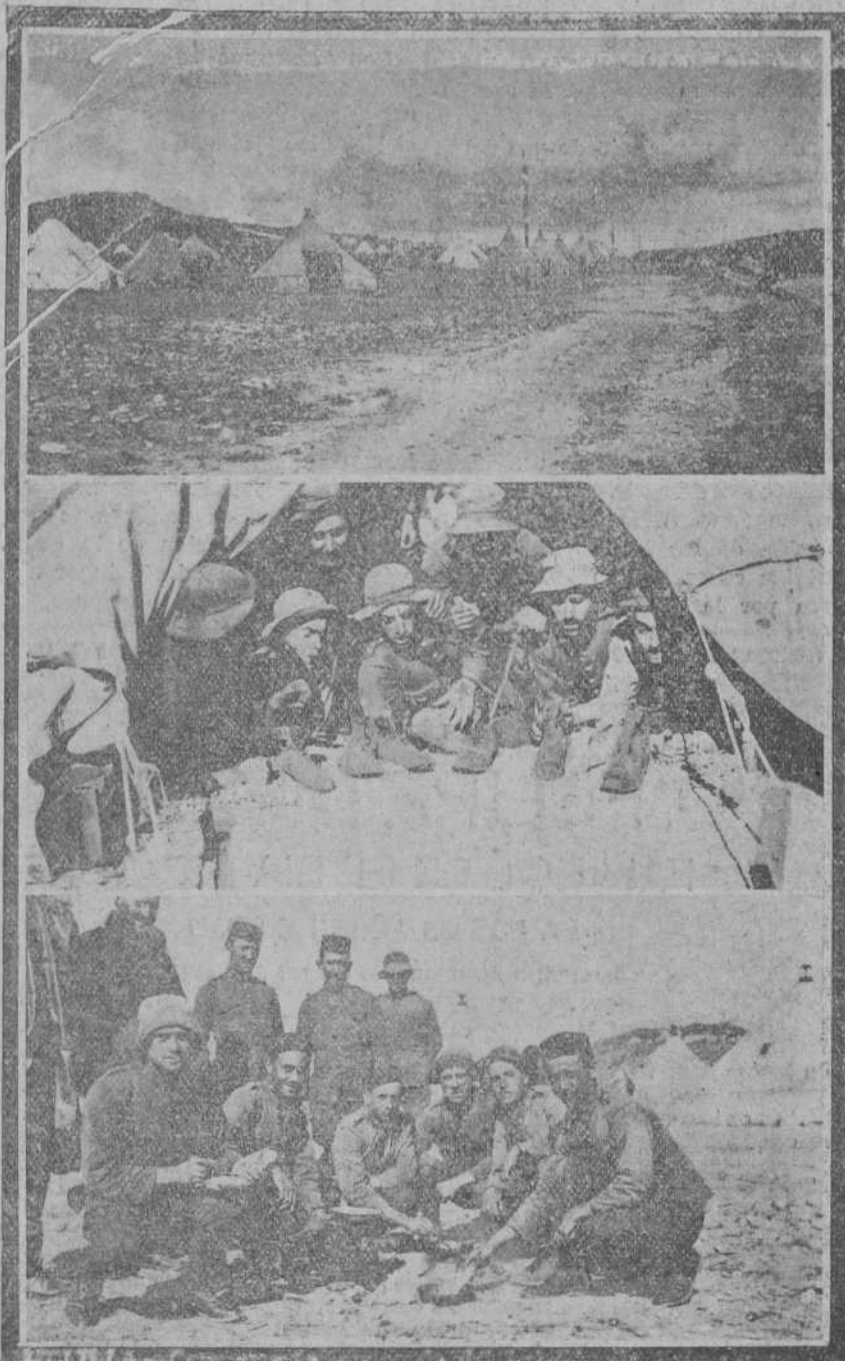
MELILLA.—Campamento avanzado del batallón de Valencia en las operaciones que se llevan a cabo actualmente.—Los habitantes de una tienda de campaña viendo, desolados, las botas vacías en la mañana de Reyes.—Un grupo de soldados del batallón de Valencia cocinando el día 6.

Los reporteros le contestaron que los señores Maura, Sánchez Guerra