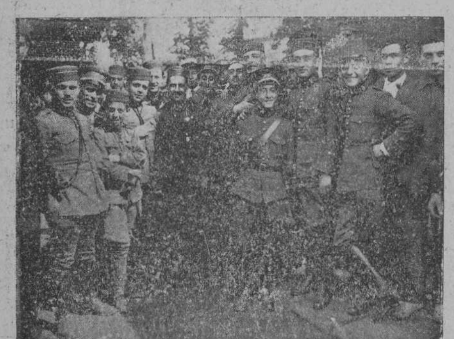
LOS JEFES Y OFICIALES DEL BATALLON EXPEDICIONARIO, EN UN DESCANSO DE LA ESTACION DE BARCENA.

El que resulte vencedor jugará contra el Santoña F. C., adjudicándosele al ganador una copa y medallas en metálico.