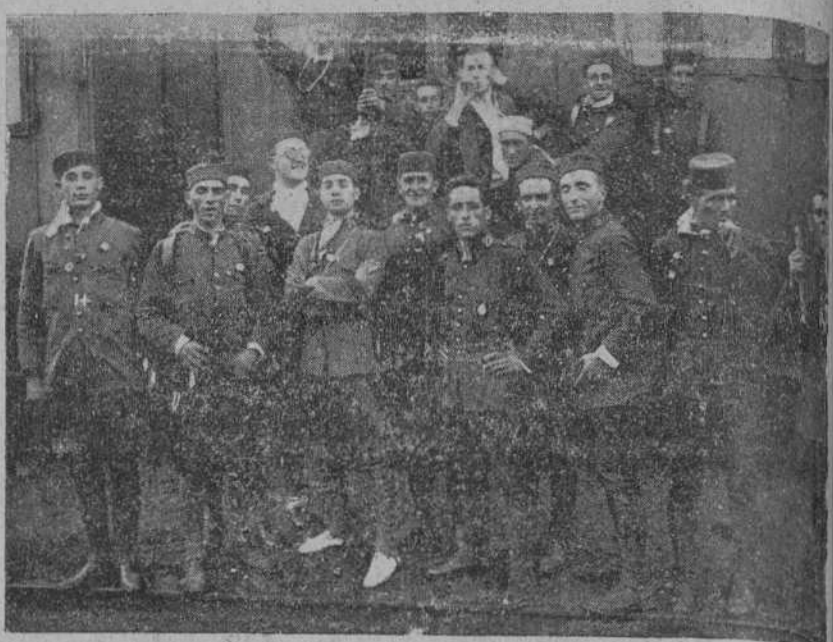
LA MARCHA DEL BATALLON DE VALENCIA.—Algunos soldados de la segunda expedición en una estación del tránsito.

VARSOVIA.—Ha dimitido el ministro de Hacienda por discrepancias con sus compañeros de Gabinete en la cuestión de los Presupuestos.