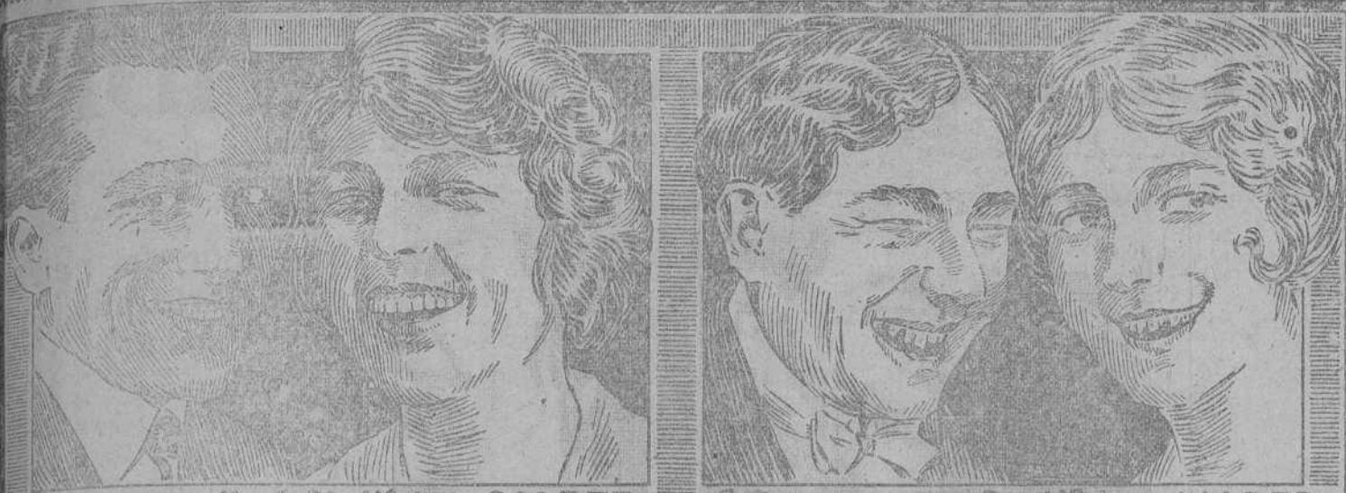
Estos usan a diario Dentífricos CALBER Estos no usan Dentífricos CALBER