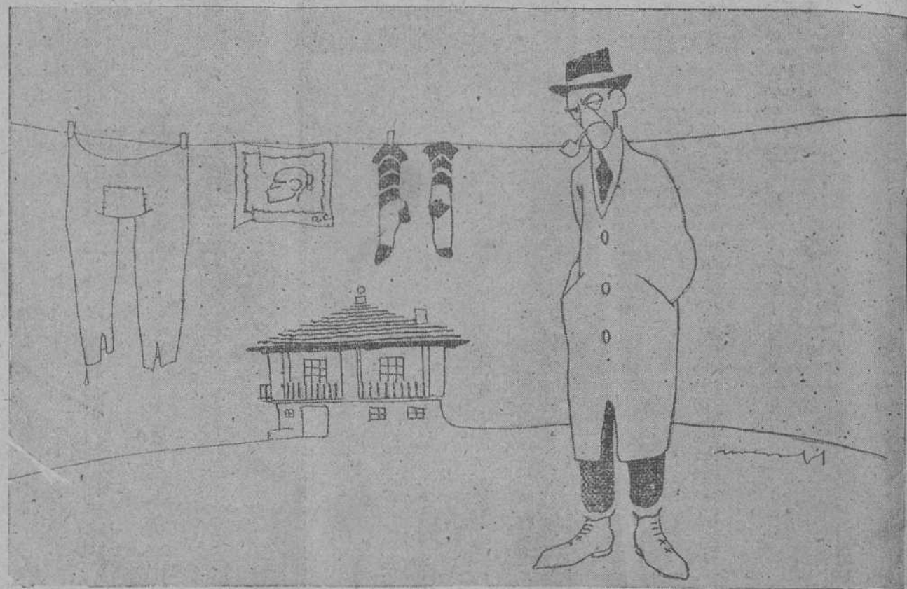
—Voy a incautarme de estos calceñines, porque huelen a Noble de un modo atroz.

Parece ser que estas entrevistas están relacionadas con la actitud en