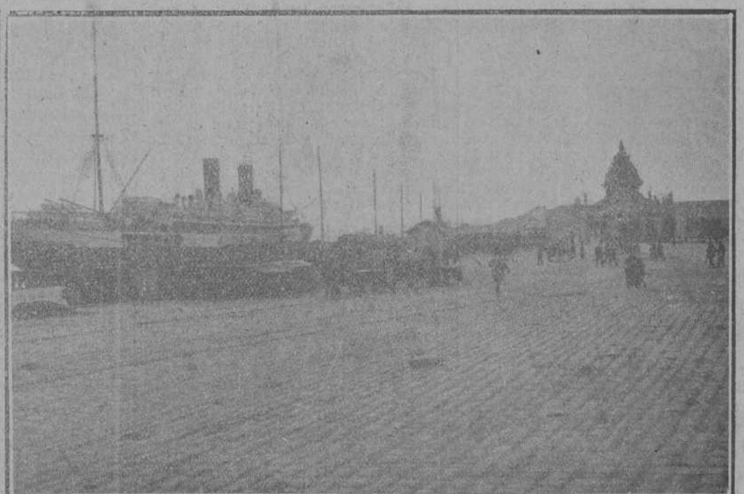
Dos interesantes vistas del puerto, tomadas por nuestro compañero «Samot», el día que atracó al muelle de Maliaño el trasatlántico «Espagne».