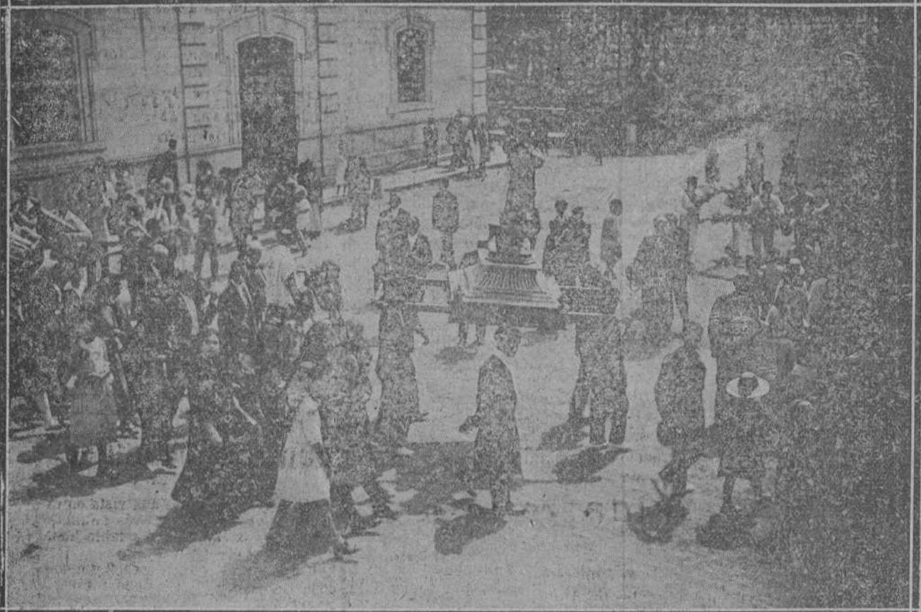
LA PROCESION DE SAN ROQUE EN VALDECILLA

Internas, medio pensionistas y externas.