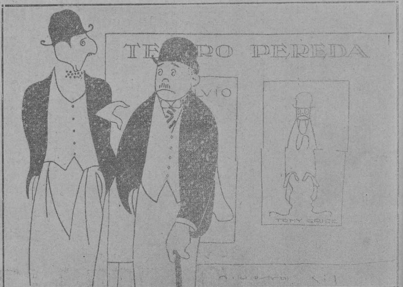
—¿VES TU? ESTO YA ES PONERSE EN RAZON. EL TEATRO DEBE SER EDUCATIVO.

b L o d p t s t d d p d l n p e d r e n tr a e p d e d s n r n l g t d o r u c p b d s e f g z d t.