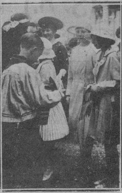
DE LA «GARDEN PARTY». EL INFANTE CARLOS, OFRECIENDO BARQUILLOS A SU ALTEZA LA INFANTA CRISTINA Y LADY BRANDIGE

zarán hoy en Palacio el marqués de Alhucemas y su distinguida esposa.