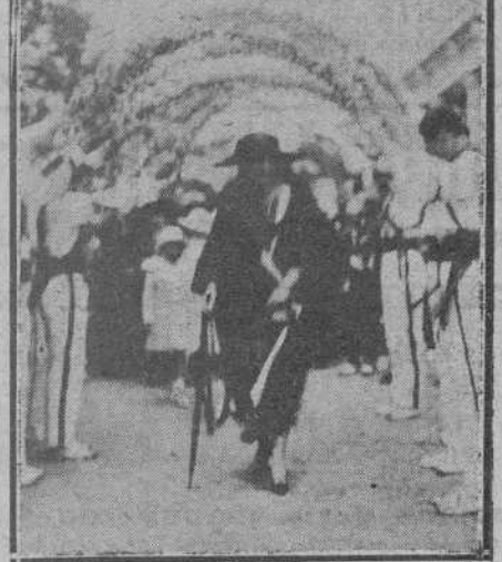
DE LA «GARDEN PARTY» DEL JUEVES. SU MAJESTAD LA REINA, AL ENTRAR EN LA FINCA DE LOS DUQUES DE SANTA ELENA, PASANDO POR DEBAJO DEL ARCO FORMADO POR LOS DANZANTES