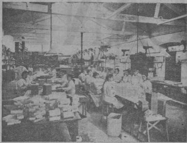
SALA DE ETIQUETADO Y EMPAQUETADO