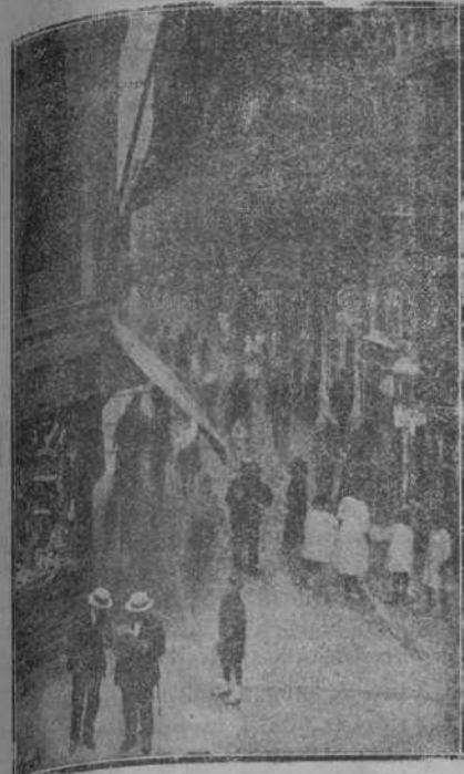
CALLE DE LA BLANCA