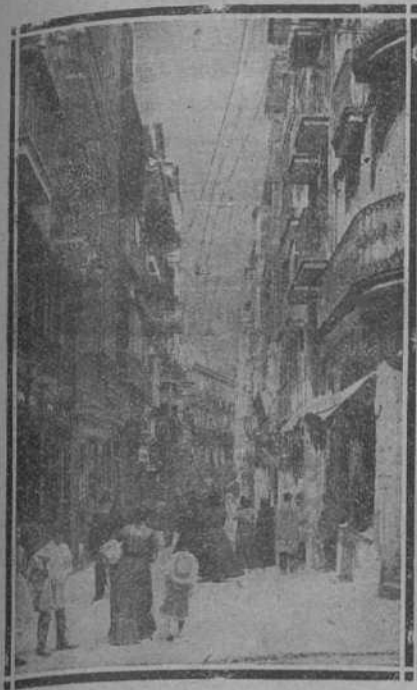
CALLE DE SAN FRANCISCO