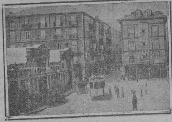
CALLE DE ATARAZANAS

LA TIJERA DE ORO Atarazanas, 5 - SANTANDER