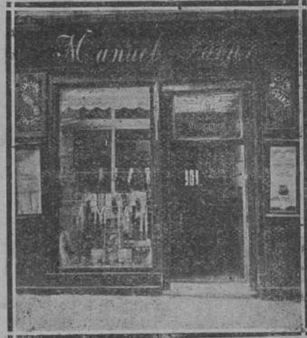
SAN FRANCISCO, NUM. 17

NOVEDADES EN MERCERÍA Y BISUTE- RIA — ESPECIALIDAD EN MEDIAS DE TODAS CLASES — GRAN SURTIDO EN MONEDEROS Y ABANICOS — PERFUME- RIA Y CAMISERIA