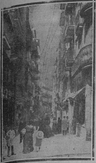
CALLE DE SAN FRANCISCO

Linoleum incrustado, Pasillos, Alfombras. para Comedor y Lavabos, Guitaperchas Hules de mes, Telas engomadas para c. mas PERSONAL COMPETENTE :: PARA LA COLOCACIÓN ::