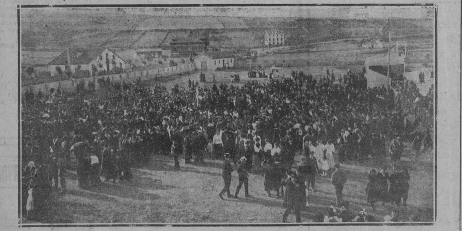
Aspecto que ofrecían los Campos de Sport durante la romería montañesa. (Fot. Samo.)

Desde luego podía achacarse esto a una falta de orientación dramática del autor; se veía claramente que Parmeno veía en su imaginación un teatro suyo, de tonos