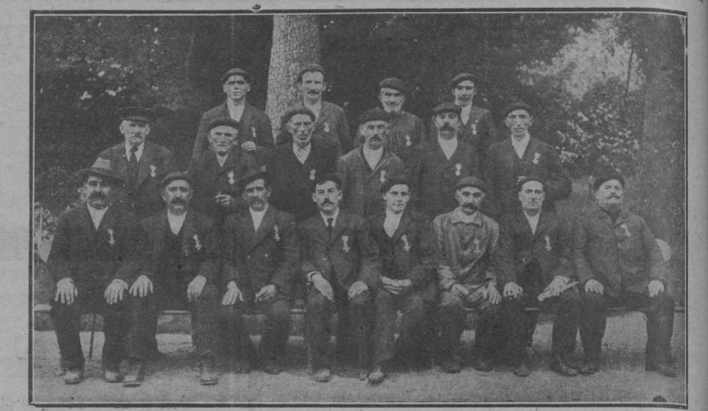
EN LOS CORRALES DE BUELNA.—Capataces y obreros de la fábrica propiedad de la Sociedad anónima José María Quijano, que han sido condecorados con la medalla de Isabel la Católica.

Una manifestación. ORENSE, 16.—A las siete de la tarde de hoy llegaron a esta capital comisiones de todos los pueblos de la provincia, que vienen en manifestación para protestar de la abusiva carestía de las subsistencias y pedir al gobernador que busque el medio de conseguir su abaratamiento.