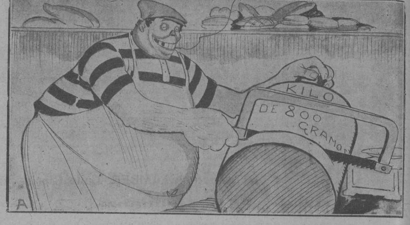
EL PANADERO. Yo lo aligero de peso, el consumidor lo suida, y vamos viviendo como buenamente se puede.