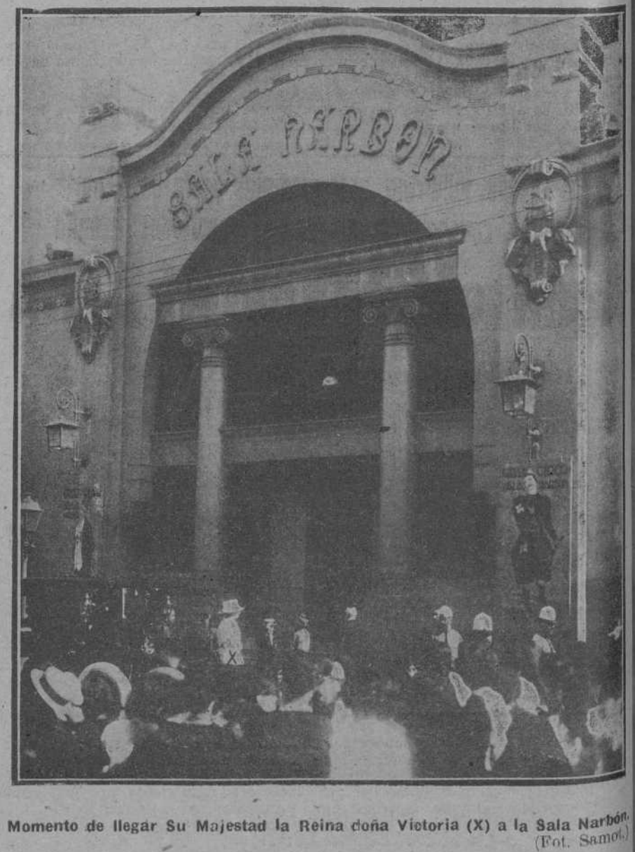
Momento de llegar Su Majestad la Reina doña Victoria (X) a la Sala Narbón.