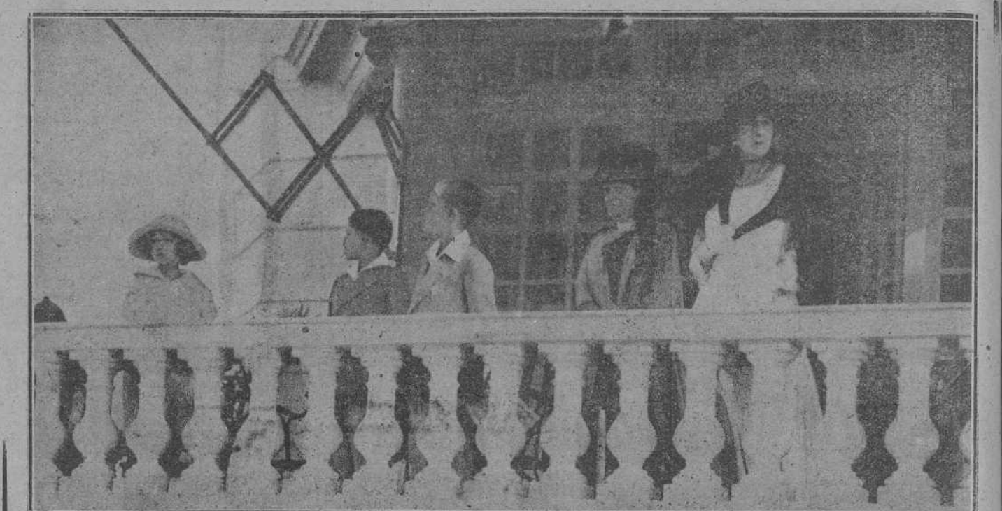
EL DOMINGO, EN EL HIPÓDROMO.—Su Majestad la Reina, el príncipe de Asturias, los infantes don Jaime y doña Beatriz y la duquesa de San Carlos, presenciando las carreras de la tribuna regia.

Esos señores, más serios que el padecimiento crónico, creen que el torero no es más que una remora con cola para la marcha progresiva, en todos los órdenes del país, sin tener en cuenta que las circunstancias ordenan y que la remora puede servir a veces de motivo para la fusión espiritual de dos naciones.