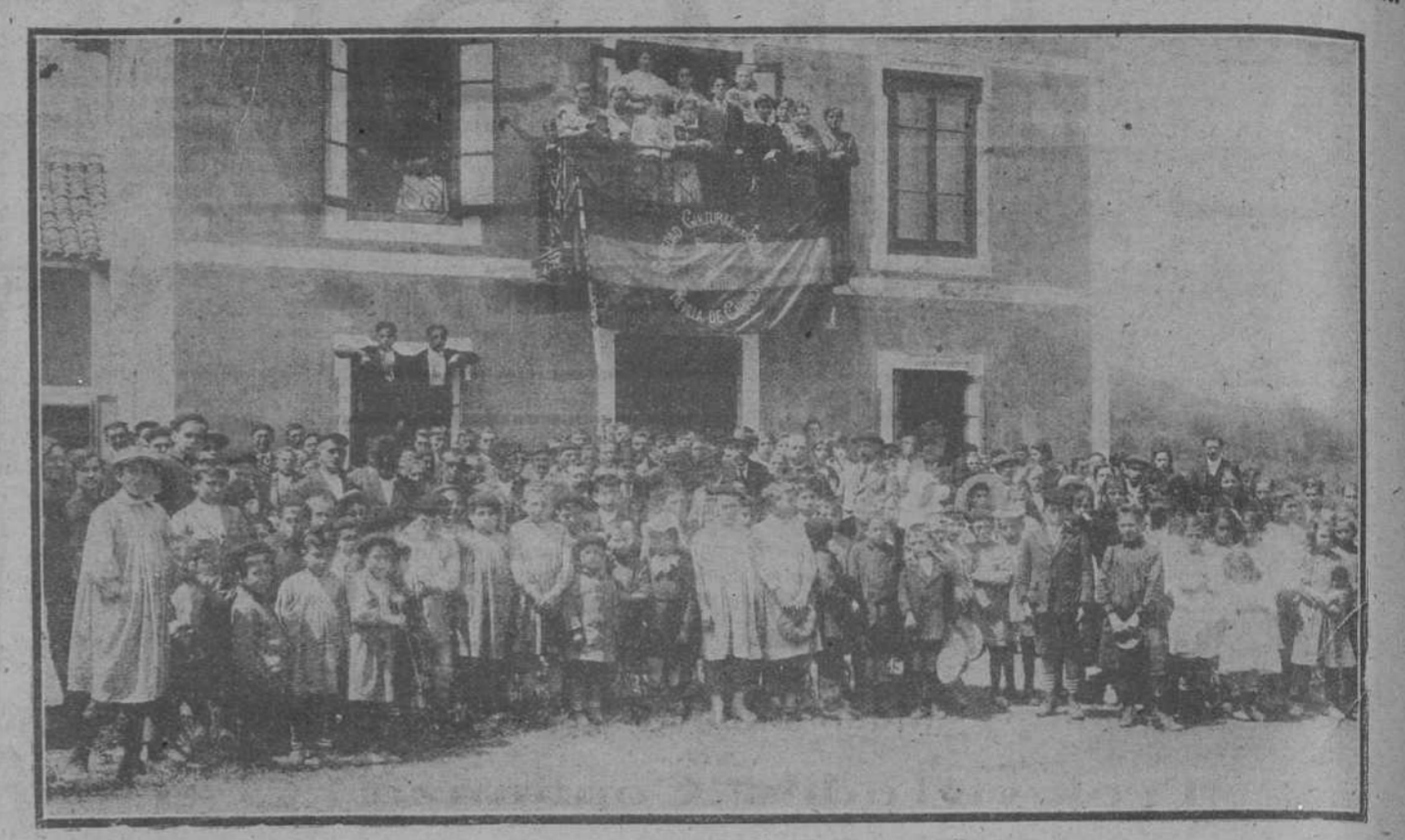
EN REVILLA DE CAMARGO.—Asistentes a la ceremonia de bendición de la bandera, rodeando a ésta frente a la escuela, en que fue izada después de la ceremonia religiosa.