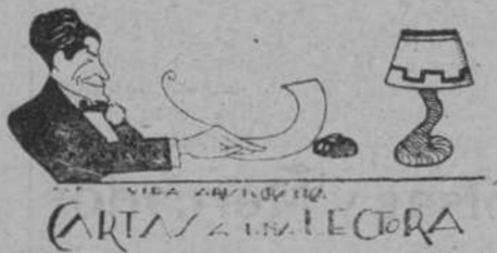
Burla, burlando. Te prometí, querida amiga, en mi última carta, seguir escribiéndote y buscar un pretexto para hacerlo, y es el caso que me encuentro por ninguna parte que me venga a cuento. Y aquí viene lo más difícil de mi situación, porque para poder pasar mucho tiempo sin escribirte, no está bien; tu me lo encargas en carta, diciéndome que te había olvidado y llamándome traidor y perjuro y otras cuantas cosas más, sino con la palabra, por lo menos con el pensamiento; y tenías razón, porque yo contraigo contigo el deber ineludible desde que vine al mundo de escribirte a menudo, contándote cuanto ocurra por el mismo. Mas aquí viene lo difícil; y si no hay nada que contarte, ¿qué hago? ¿Buscar un pretexto, dices? Bueno, sí; pero ¿y si soy tan torpe que no lo encuentro? Porque tienes que hacerme cargo, bella amiga, que si eres una señorita, linda, gentil, buena, ya sabes cómo, porque para eso tienes espejos que te lo repitan a todas horas. ¿Te pones seria? ¿Y por qué? ¡Ah, ya caigo. Es que necesito que al decirte que el espejo te lo repite a todas horas te llamo presumida, muy inocente, ¡Mujer! ¡Que suspicaces sois todas! Te juro que no era esa mi intención; además de que el espejo es un fiel aliado vuestro, de vuestra belleza; ante él ensayáis esos planes a los que nadie ni nada se resiste; porque ya sabes aquello que decía el poeta: «omendose y quitándose alfileres, hacen sitios de Troya las mujeres.» Pero volviendo a lo que estamos; habíamos quedado en que tú eras una señorita, linda y gentil, y yo, en esto no había mos quedado, pero os decimos ahora y el efecto es el mismo; yo soy un muchacho joven... No te sonrias maliciosamente, porque no hay razón para ello. La palabra seductor no ha pasado por mi imaginación, pero te has sonreído como si yo tuviese esa pretensión y no me has dejado continuar. Iba a decir que yo soy un muchacho joven... tienes que hacerme cargo que sin más ni más no me voy a poner a escribirte, porque la gente es muy mala y sabe Dios lo que daría en decir. Tengo que buscar algún pretexto, para que a nadie le choque nuestra correspondencia... unilateral; porque escribir por escribir, llenar pliegos y pliegos diciendo siempre lo mismo, con la particularidad de que al leerlo parece siempre distinto, sólo es cualidad de los enamorados que escriben y de los enamorados que leen. ¿Y cómo encuentro yo el pretexto para escribirte? Porque ¿inventando? ¡Horror! Como me pondrías de mentiroso, traidor... No, y tendrías razón. En fin, lo pensaré. Por esta vez, burla, burlando, ha salido la carta. Para la próxima ya veremos; pero será de algo interesante; te lo prometo tu.