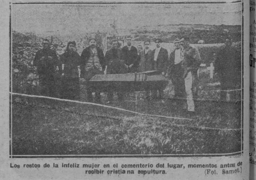
Los restos de la infeliz mujer en el cementerio del lugar, momentos antes de recibir cristiana sepultura.

Un depósito de materias inflamables.—Proposiciones que pudo asumir el siniestro. Pegado a la casa quemada existe un depósito de materias inflamables, pertenecientes a las minas del señor Mac-Lennan.