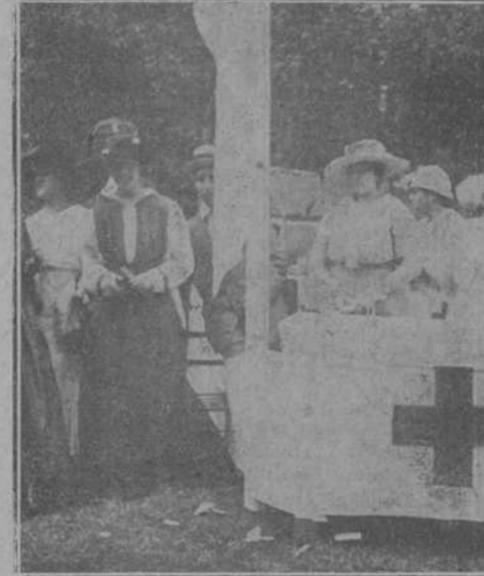
DE LA GARDEN PARTY.—La tómbola.