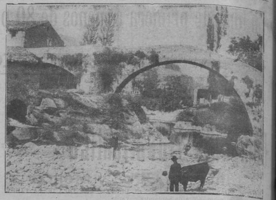
PAISAJES MONTAÑES.—El puente de Liérganes.

Por la noche se puso en escena otra obra francesa, titulada «La hermana mayor», original de Paul Givault, que no nos explicamos cómo hay actores que se atreven a representarla, porque es imposible, así, imposible hacer una obra más insulsa y más inexplicable.