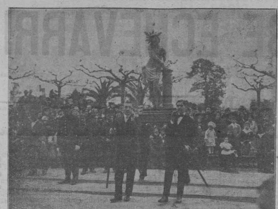
JUEVES SANTO.—La Flagelación.

«Bilbao, 17.—«Racing Club».—Proponemos para partido domingo referido a Zubizarreta, del «Athl. Sport». Telegrafista urgente Sabas, Estación, 8, si aceptan proponer otro.—«Deusto».