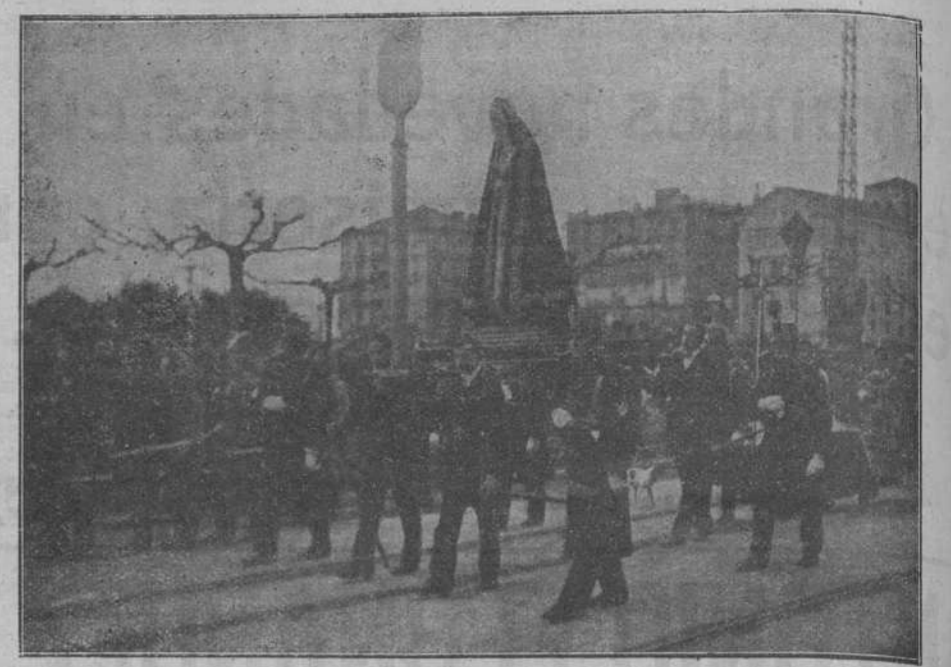
JUEVES SANTO.—La Dolorosa.

En las calles centinela, especialmente en la Puerta del Sol, se celebró la procesión de la Pasión, que interpretó con gran