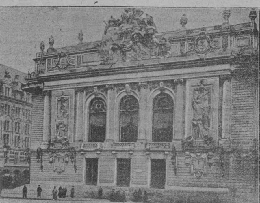
DE LA GUERRA EUROPEA.—El teatro de Lille, que estaba en construcción cuando los alemanes ocuparon la ciudad y que lo han terminado suntuosamente, inaugurándole con una de las compañías dramáticas más importantes de Alemania.

El señor presidente da cuenta de haber sido puesta en vigor, en 1 de marzo, una tarifa especial para el transporte de maderas desde este puerto a Salamanca, Zamora, Plencia y otras plazas, que tenía solicitada esta Cámara de Comercio y por la cual se rebajan las tarifas anteriores para el transporte de dichas mercancías a las citadas ciudades, lo que co-