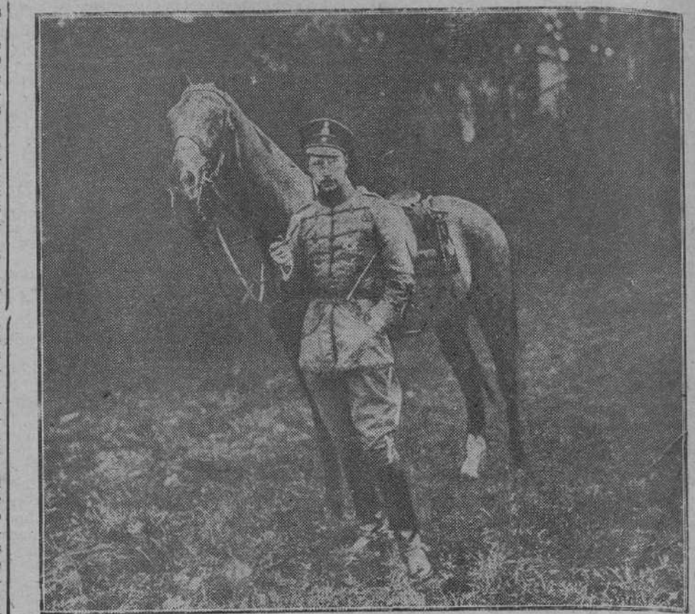
EL KRONPRINZ.—Ultimo retrato del heredero del Imperio alemán, hecho en los campos de batalla de la Champagne.