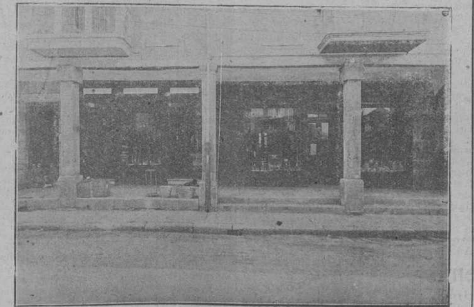
Importante establecimiento de don Adolfo de la Peña.—Ferretería, loza, muebles y vidrio.