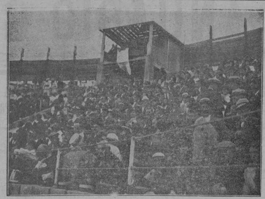
LA NOVILLADA DE AYER EN SANTONA.—UN DETALLE DEL TENDIDO DE SOMBRA NUMERO 4.—(FOT. SAMOT)

UTRERA. 8.—Se lidió ganado de Contral. Vázquez, en el primero, entra a matar superiormente, recetando una media estocada al toro, un buen pinchazo y una superior.