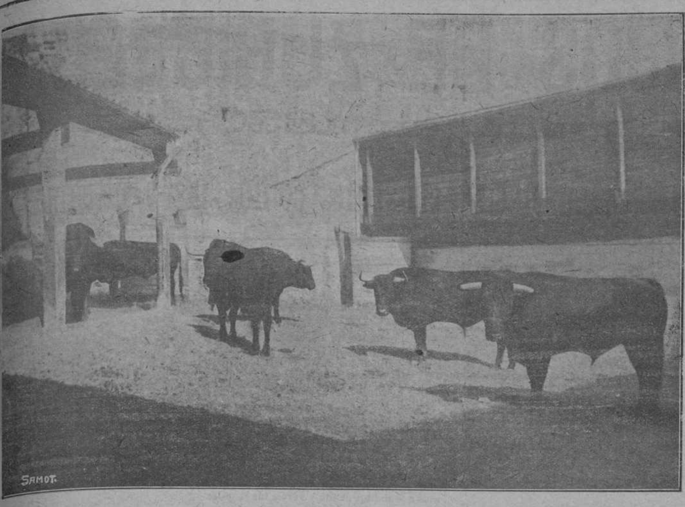
TOROS DEL MARQUÉS DEL SALTILLO, QUE LIDIARÁN ESTA TARDE GALLO, GALLITO Y BELMONTE.

se escapó esta mañana un toro, causando la consiguiente alarma. Hubo los consiguientes carreras y sustos, pues al animal le dió por recorrer varias calles, causando infinidad de contusiones, hasta que logró reducirse y encerrarla.