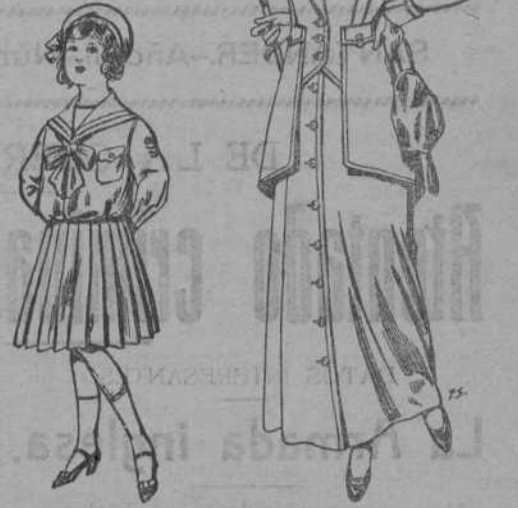
Trajes de lana negra, azul y color, para señora a pesetas 65. Trajes de vicuña o jerga, vicuña o jerga, para niños de 10 a 16 años de pesetas 32 a 73.