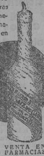
VENTA EN FARMACIAS