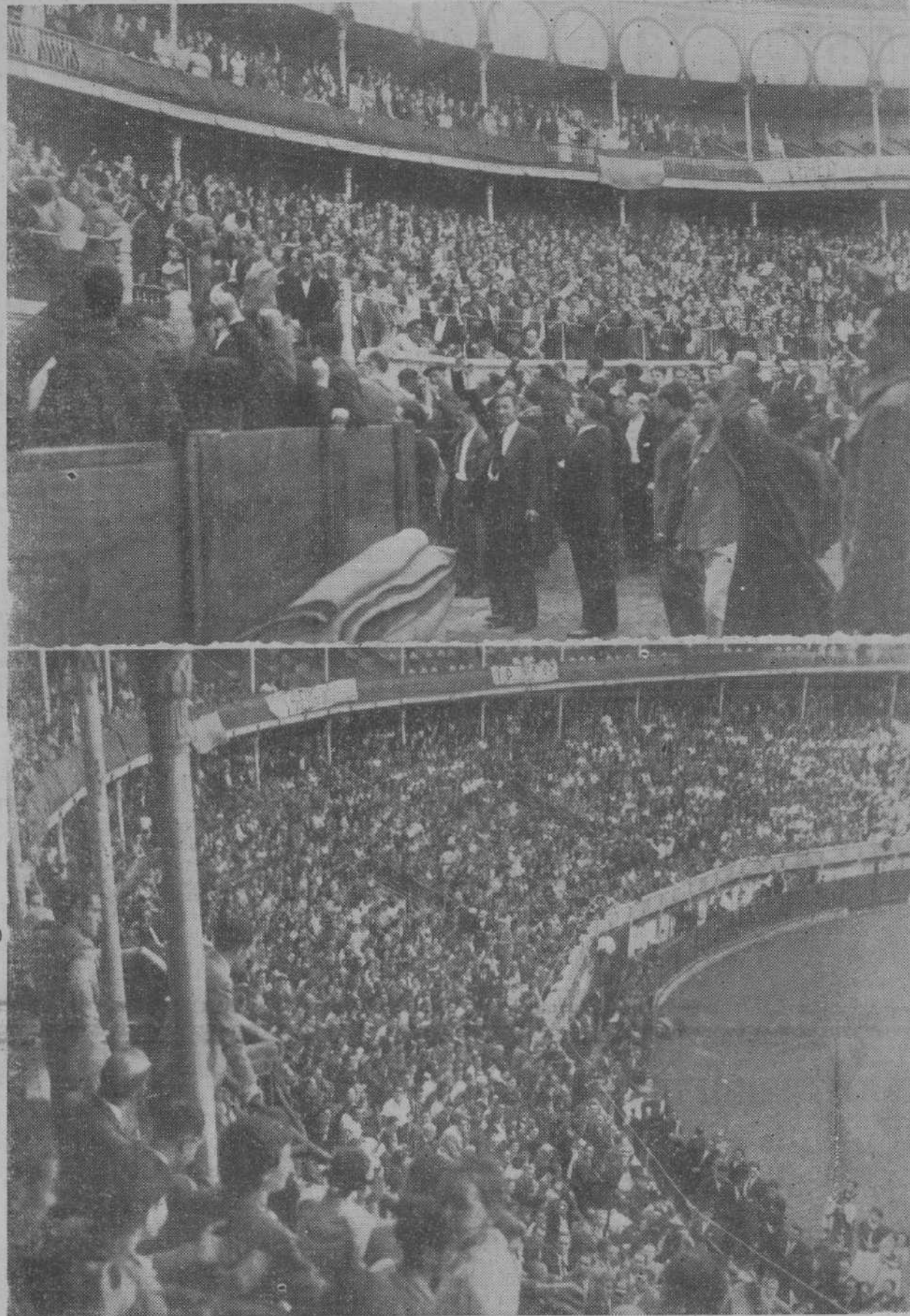
Los magníficos aspectos de la plaza de toros, momentos antes de comenzar el festival del domingo.