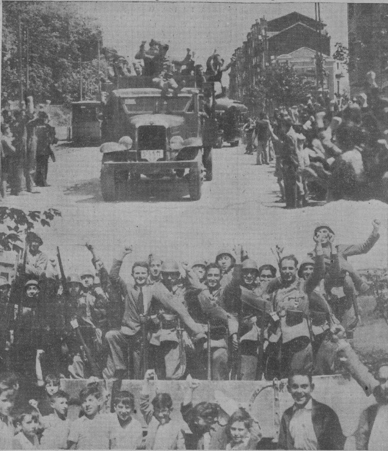
Al arrancar ayer la columna de tropas del Ejército y milicianos populares se produjeron estas escenas de entusiasmo desbordante, testimonio vivo del ánimo con que van las fuerzas y con que el pueblo las despidió, confiando en la victoria. (Foto Alejandro).