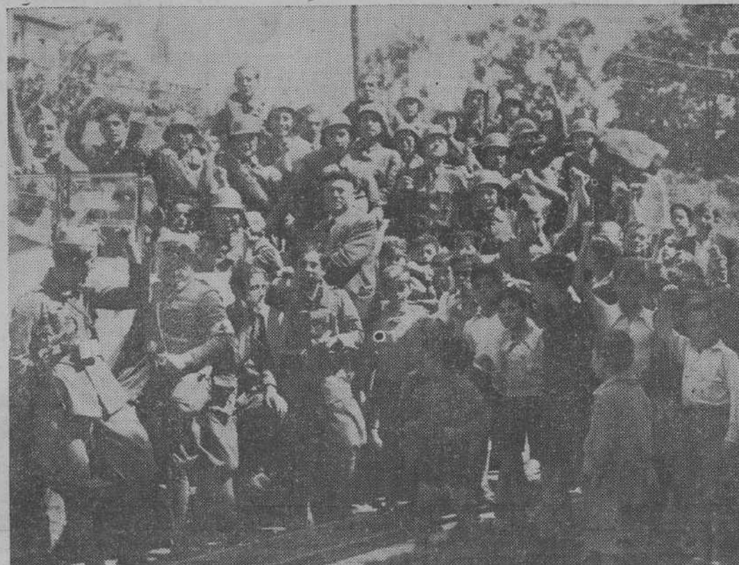
Un momento, uno de los muchos momentos de intenso fervor republicano de las fuerzas leales que ayer salieron de la ciudad...

Los aplausos con que fervorosamente se les aclama es el tributo a su gesto sereno de hombres de honor verdadero y de honor de hijos del pueblo. Será gran suerte para la República que, después de la victoria, se encuentre sólidamente unida y disciplinada esta fuerza, que ha de ser el pilar más firme del nuevo estado de cosas.