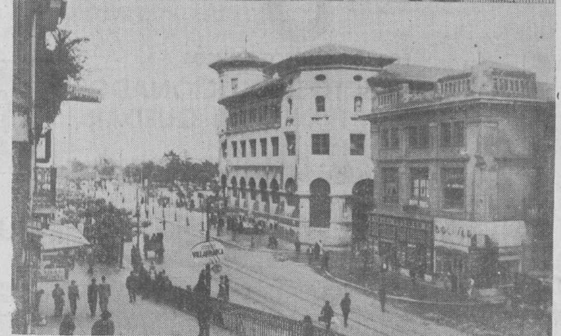
La plaza de Velarde, la Ribera, eran así, en aquellos tiempos en que había tranvías de mulas y las mujeres gastaban unas faldas con más tela que una paracaídas... Y he aquí la radical transformación que ha experimentado aquel lugar, visto, en una y otra «foto», desde el mismo sitio. («Fotos» Archivo y Alejandro.)