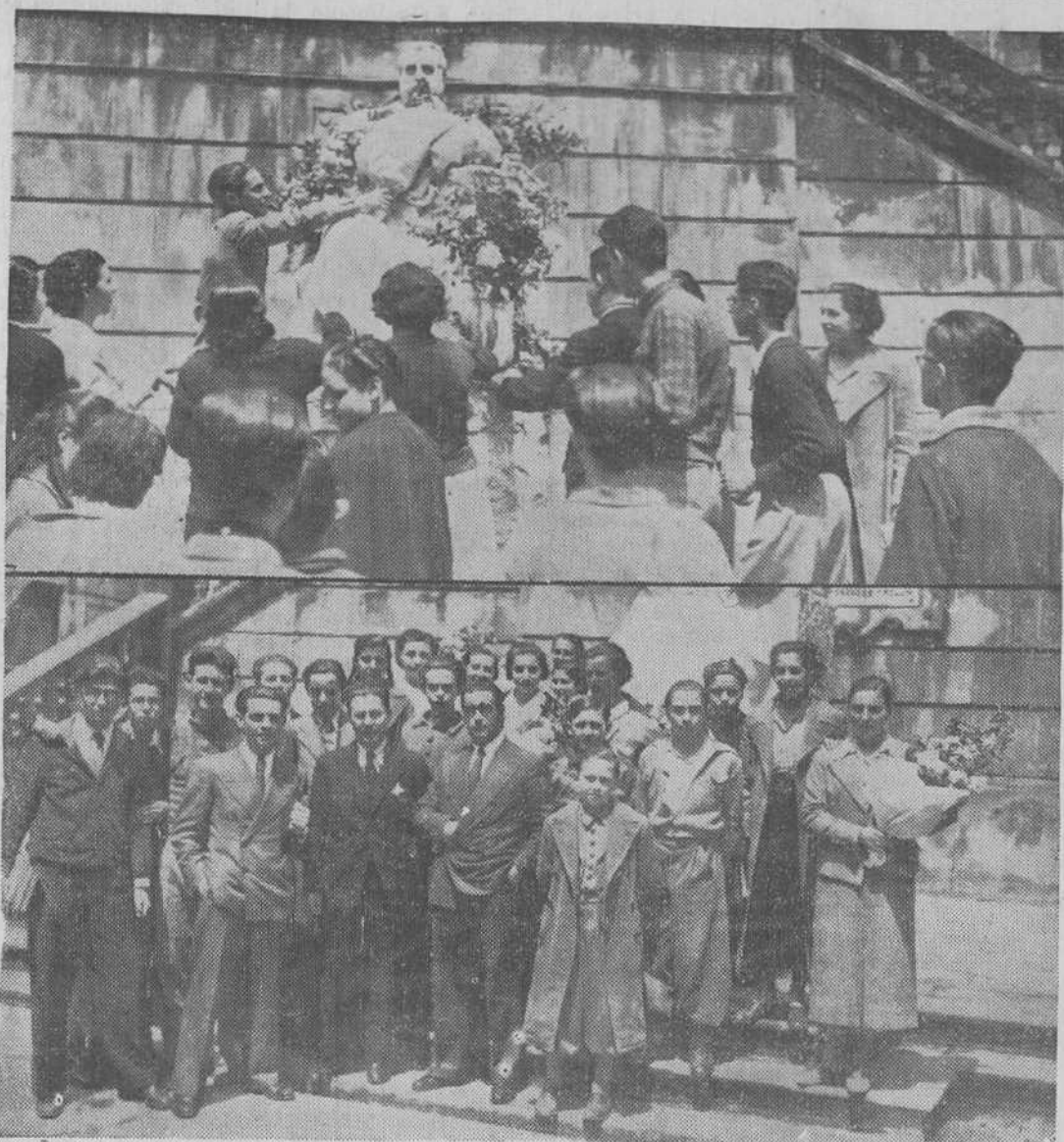
Representaciones de los alumnos de los Institutos santanderinos, depositando flores sobre la estatua de Menéndez Pelayo, con motivo del aniversario de la muerte del genial polígrafo.

Para el neutral observador, Prieto habló también en revolución. Tan en revolucionario, que los tímidos espíritus de hoy, los arrogantes de ayer que, ante el consejo de un sociólogo tan eminente como el P. Laburu, invitádoles a dar por las buenas lo que luego les iban a quitar por las malas, moviéndoles a dar tres para conservar dos, se encogían de hombros y le calificaban de indocumentado, indecible y «chiflado», pueden ir perdiendo la esperanza que, como a un clavo ardiendo, se había asido al señor Prieto. Porque se trata de una discrepancia de simple táctica. Largo Caballero quiere todo el Poder para el Partido, sea por el medio que sea, aun el de la violencia y con la violencia. Prieto, más cauto, prefiere realizar el programa sin nuevos sacrificios para la clase trabajadora, y por eso aboga por el sistema colaboracionista, a base del programa aprobado en 1934 unánimemente por las Comisiones ejecutivas del Partido Socialista Obrero y de la U. G. T.