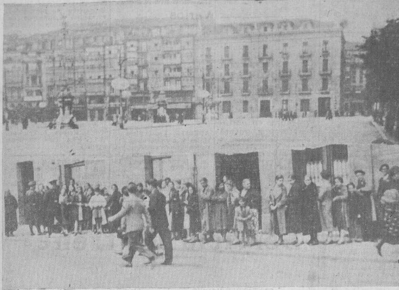
NOTAS DE LA HUELGA GENERAL.—Un detalle de la ciudad en paro absoluto.—A las puertas de las panaderías se formaron colas...