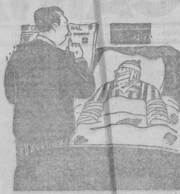
—Enhorabuena, chico. Sabes en primera plana en todos los periódicos.