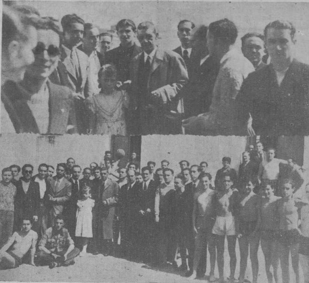
En la mañana del domingo hizo el alcalde, don Ernesto del Castillo, una visita al Instituto de Cultura Física «Cantabrias». Durante el transcurso de la misma, los directivos señalaron al señor Del Castillo que, dentro del marco democrático de la Sociedad—compuesta de jóvenes estudiantes, obreros y empleados— se iban cumpliendo aquellos planes de ennoblecimiento y mejora de la raza con el lento ritmo que impone, dado su carácter popular, lo «reducido de las cuotas mensuales, y a pesar de lo cual se han creado y mejorado las secciones náuticas, todas las modalidades del deporte terrestre y estando en período de reorganización la sección de circo amateur, que tantos éxitos obtuvo en su anterior etapa. En compañía de la Directiva recorrió el resto de las instalaciones—gimnasio, vestuario, sección femenina, cuarto de duchas, Secretaría, salón de lectura y pabellón de yolas—y la Junta recibió el parabién del alcalde. Preguntado por la primera autoridad municipal la cifra de asociados a que alcanzaban las ventajas de este Instituto, se le hizo saber que el censo social se aproximaba a cuatrocientos, cifra tope que no podrá ser rebasada por no consentir el local, a pesar de su amplitud, un número mayor de socios. El alcalde salió satisfecho de la visita, dos momentos de la cual recogen estas fotos de Alejandro.

A ponerse a este nivel tienden ahora los restantes países. Y, como consecuencia, renitamos una vez más, se van abandonando los principios de seguridad colectiva seguidos hasta la fecha, para buscarla en el mantenimiento de formidables efectivos militares.