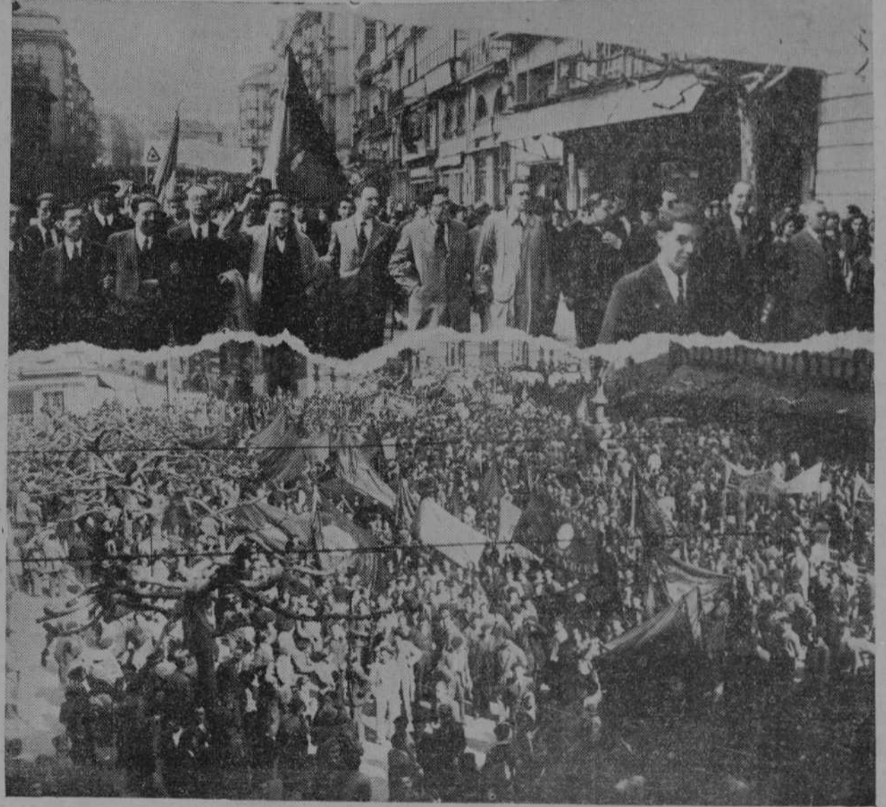
La presidencia de la manifestación al desfilar por la Ribera.—Los manifestantes, en la plaza de Pi y Margall, al ponerse en marcha.—(Fotos Alejandro)

LA MANIFESTACION A ello quedó reducido el acto organizado por el Frente Popular y que culminó al mediodía del domingo. En la plaza de Pi y Margall, frente al palacio del Ayuntamiento, fueron congregándose compactos grupos de izquierdistas de todos los matices encuadrados en el Frente Popular, con banderas, camisetas rojas y azules con corbatas encarnadas, distintivos, etcétera, muchos de ellos llegados de varios lugares de la provincia en trenes, autobuses, camiones y coches particulares, hasta llenar por completo dicha plaza. A las doce de la mañana, y con las señales advertidas del disparo de tres bombas, se puso en marcha la manifestación hacia el Gobierno civil, después de haber recibido normas en la Alcaldía los diferentes Comités. El paso de la comitiva, acordonada por las juvenidades del Frente Popular, fué presenciado por bastante público. Frente al Gobierno civil se estableció la muchedumbre, subiendo una Comisión al despacho del gobernador civil, siendo recibida por éste.